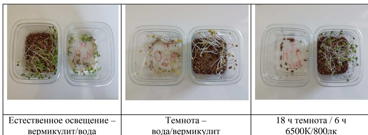
Рис. 2. Брокколи, сорт Тонус, субстрат/режим освещения

В отдельном опыте изучалось влияние кратковременного ежедневного освещения проростков брокколи светом синего спектра 6500К/800лк при проращивании на стерильном вермикулите. Установлено, целевые показатели у 2-х недельных проростков – повышение массы проростка (до 35 %) и низкое соотношение К/Г отмечались при экспозиции синего