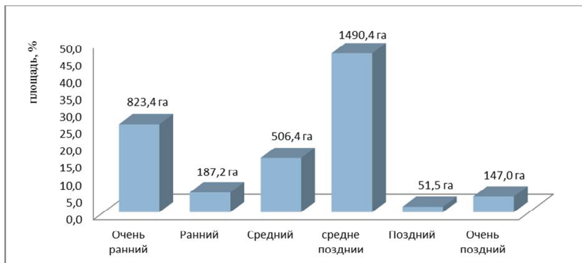
Рис. 1. Структура распространения насаждений столовых сортов винограда в Республике Крым по срокам созревания

В Государственный реестр селекционных достижений, допущенных к использованию в Российской Федерации за 2014 год, внесено 80 столовых сортов. Из них только 16 имеются в сортименте винограда Крыма, из которых 7 сортов очень раннего срока созревания, 2 сорта раннего, 1 сорт среднего срока созревания, 4 сорта средне-позднего и 2 сорта позднего срока созревания.